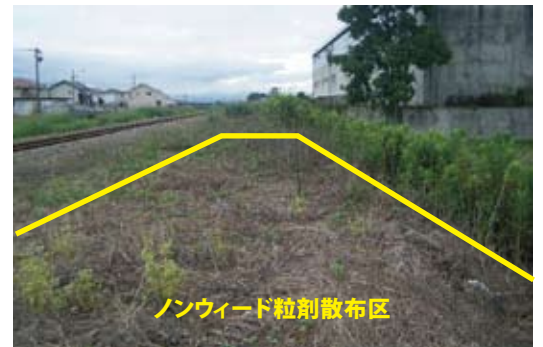
ノンウィード粒剤散布区